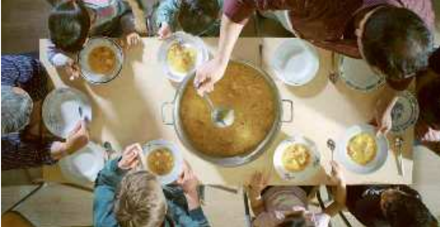
Kinder bekommen warme Mahlzeit in OT-Arbeit des CVJM Halle

Über die Versorgung mit dem Nötigsten und einen verantwortlichen Umgang mit Lebensmitteln