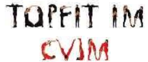
Topfit im CVJM