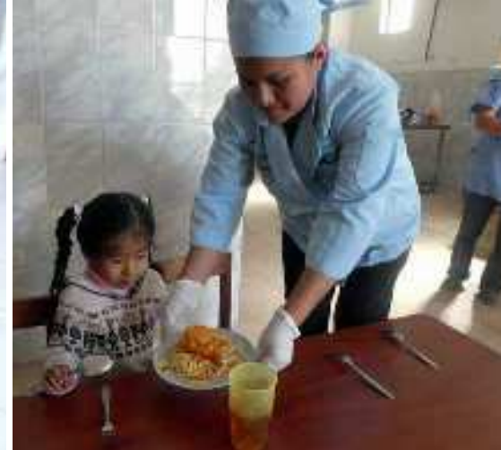
Mädchen mit warmer Tagesmahlzeit

► Gott hat Regen geschenkt. Er hat die Saat aufgehen lassen. Keine Dürre, kein Krieg, keine Überschwemmung und kein Ungeziefer hat die Ernte zerstört. Im kommenden Jahr müssen wir keinen Hunger leiden.