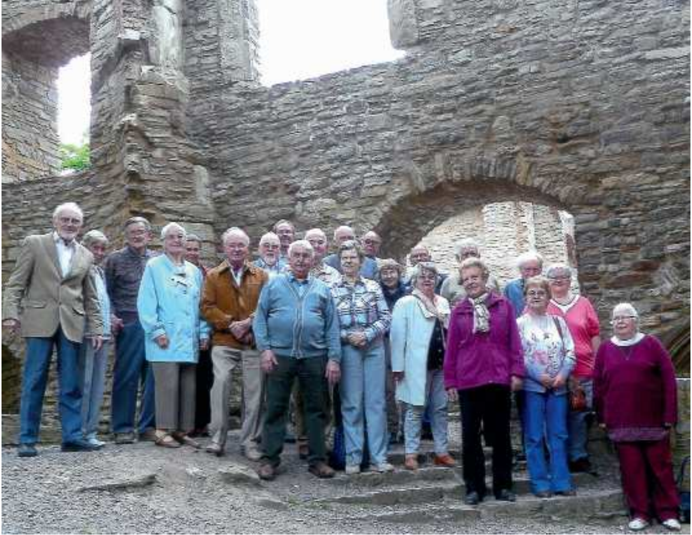
Ein Gruppenbild muss immer sein: Die Altfreunde am 28. Mai 2019 vor dem Mittelort auf Schloss Mansfeld.