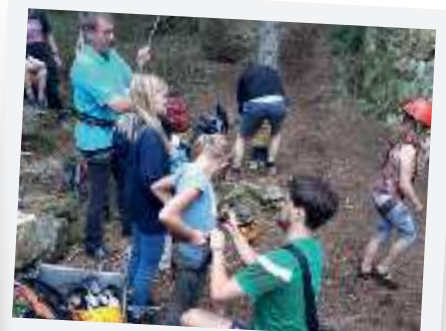
Klettern an der Silberwand