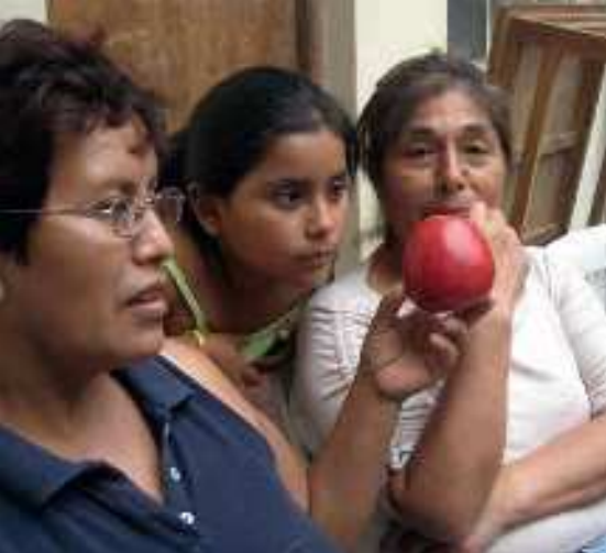
Frauen bei einem Workshop über Ernährung

Wie ein Projekt von Aktion Hoffnungszeichen benachteiligten Familien hilft