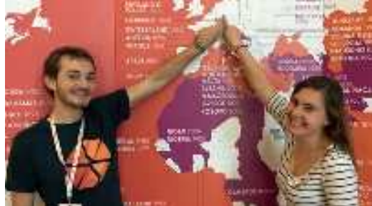
Jeder soll bei uns seinen Platz haben