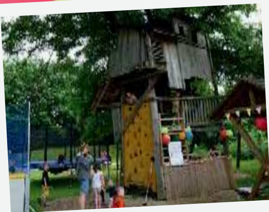
Der CVJM Joel feierte mit einem bunten Kinderfest mit zahlreichen Sportangeboten den CVJM-Geburtstag