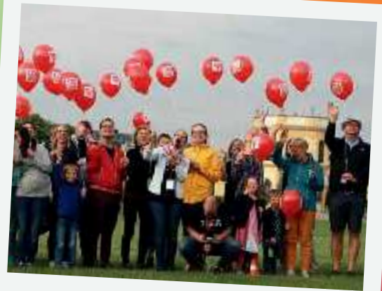
In Kassel feierten die CVJM-Ortsvereine gemeinsam mit dem CVJM Deutschland und der CVJM-Hochschule in der Karlsaue mitten in der Stadt

► Am 6. Juni war es endlich so weit: Der CVJM erinnerte sich an seine Gründung vor 175 Jahren. In Deutschland wurde das Jubiläum an vielen Orten und mit ganz verschiedenen Partys gefeiert. Hier erhaltet ihr einen kleinen Eindruck von den Feierlichkeiten.