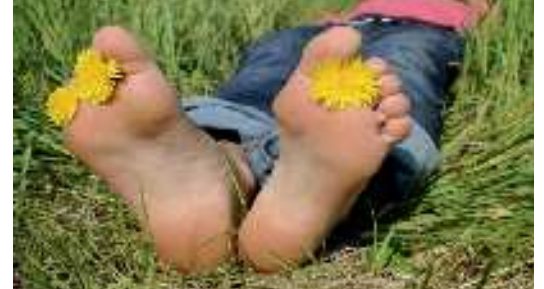
Gönne dich dir selbst