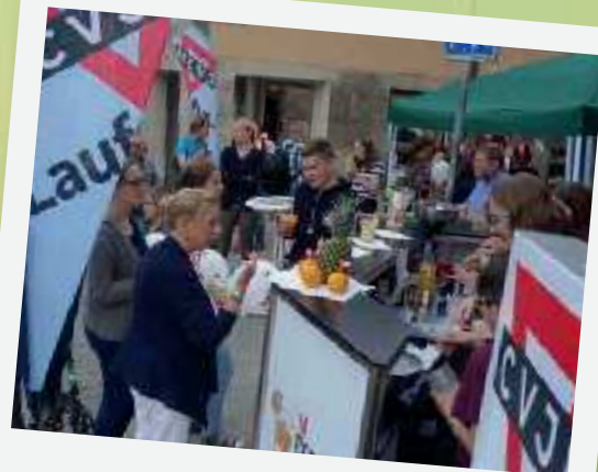
Der CVJM Lauf warb mit einem Straßenfest für die Angebote des CVJM

Bundesministerium für Familie, Senioren, Frauen und Jugend