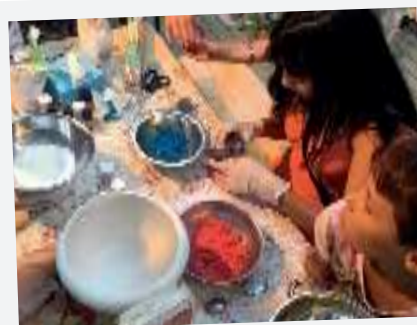
Seife und Waschmittel preiswert selbstgemacht

»Gruppe geht vor!« war deshalb eine andere wichtige Regel. Viele zogen sich hinter dem Handy oder der Spielkonsole zurück und wollten die Angebote zum Spielen, Wandern oder Basteln nicht annehmen. Aber die Regel half. So gab es überraschende Erfahrungen beim Bohren, Sägen, Schleifen.