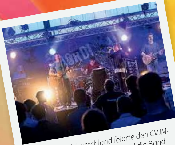
Der CVJM Norddeutschland feierte den CVJM-Geburtstag beim Nordival. Im Bild die Band Beatween