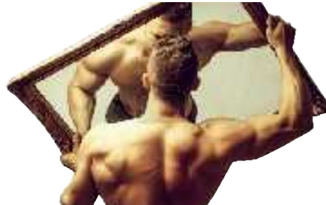
Wie gefährlich sind Schönheitsideale?