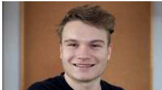
Wettkampf mit dem Leben